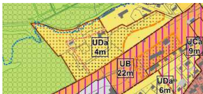
Extrait zonage projet de PLU

La MRAe recommande ainsi de mieux expliciter les choix d'implantation des secteurs de projets et d'éclaircir la situation de l'espace boisé classé identifié par le PLU en vigueur dans le périmètre de l'opération Fort l'Oiseau.