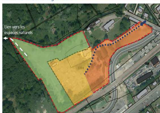
Schéma d'aménagement _ OAP Fort l'Oiseau