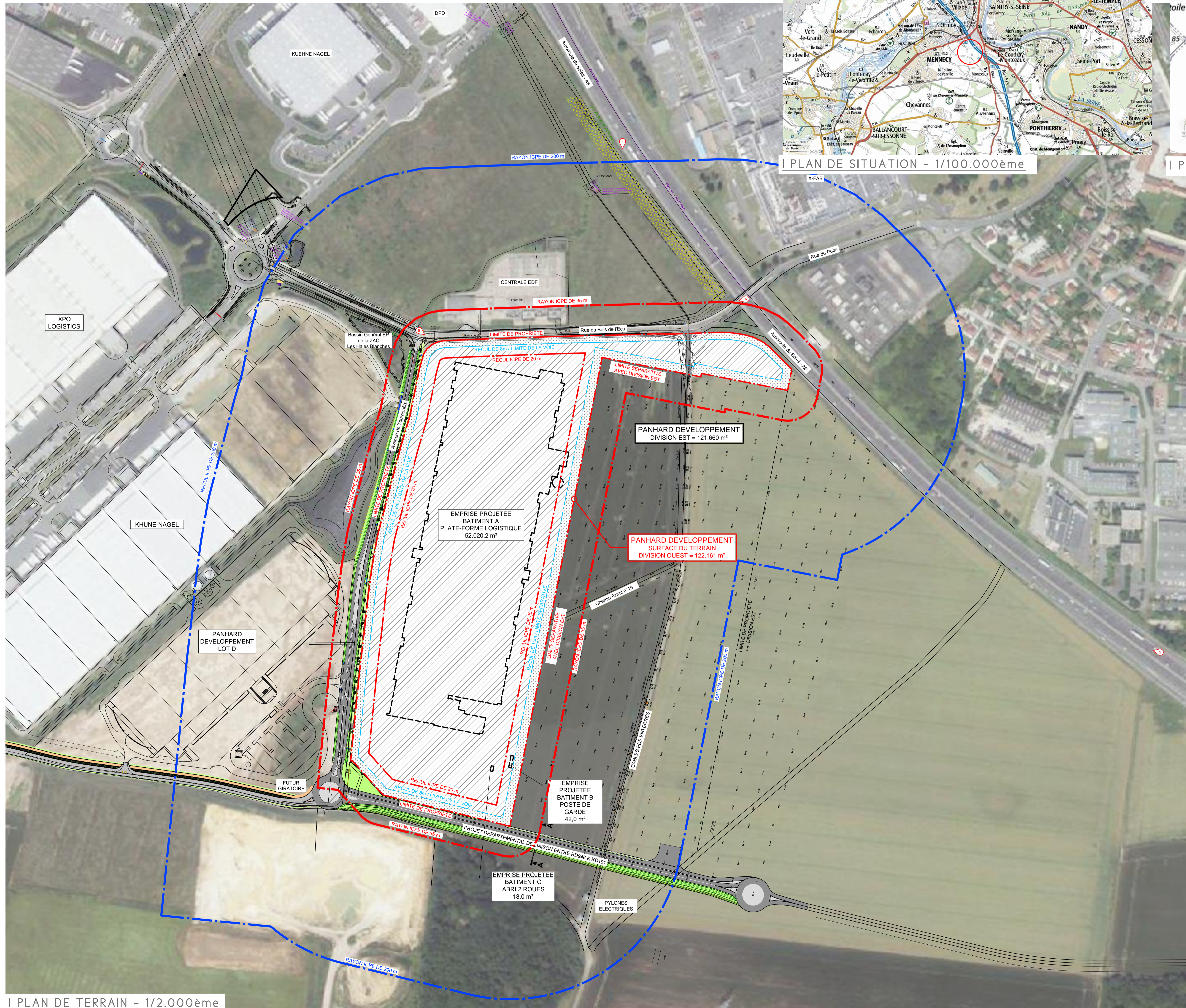
PLAN DE TERRAIN - 1/2.000ème